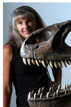
マリー・シュバイツァー教授 (米ノースカロライナ州立大学生物科学部)